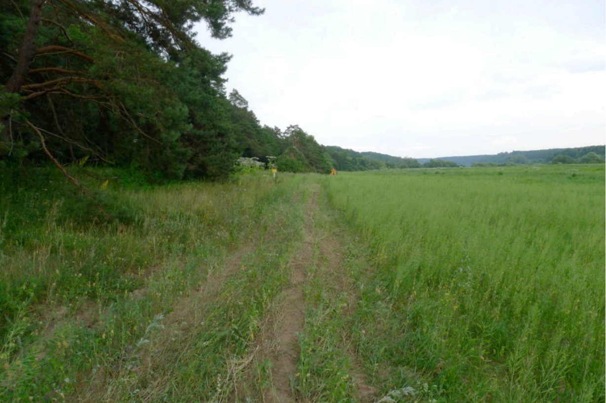
Фото 3. Участок с уложенным кабелем и рекультивированной поверхностью земли.