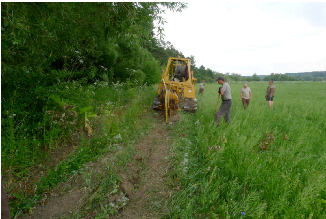
Фото 1. Кабелеукладчик и пройденный им участок с уложенным под землю кабелем.