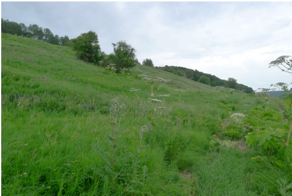
Фото 1. Юго-западная часть «Усадьбы Авчурино» - место вхождения трассы волоконно-оптической линии связи (ВОЛС) на территорию объекта культурного наследия. Вид с запада.