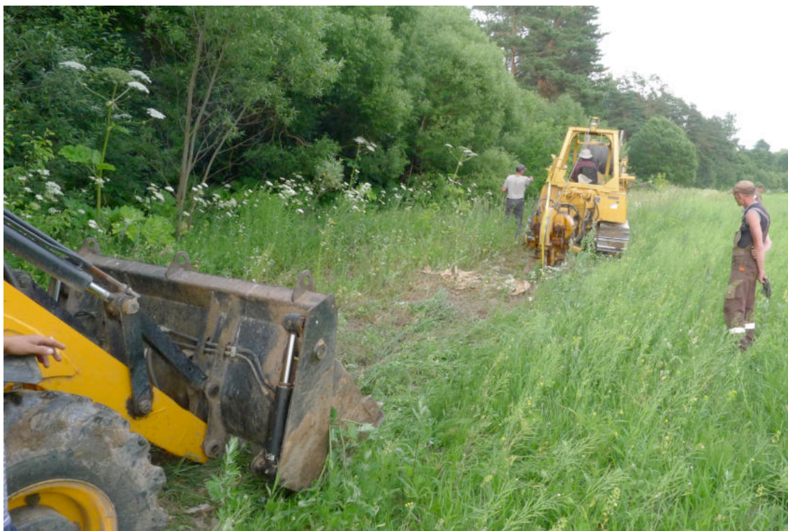
Фото 2. Кабелеукладчик и следующий за ним экскаватор, рекультивирующий поверхность земли после укладки кабеля.