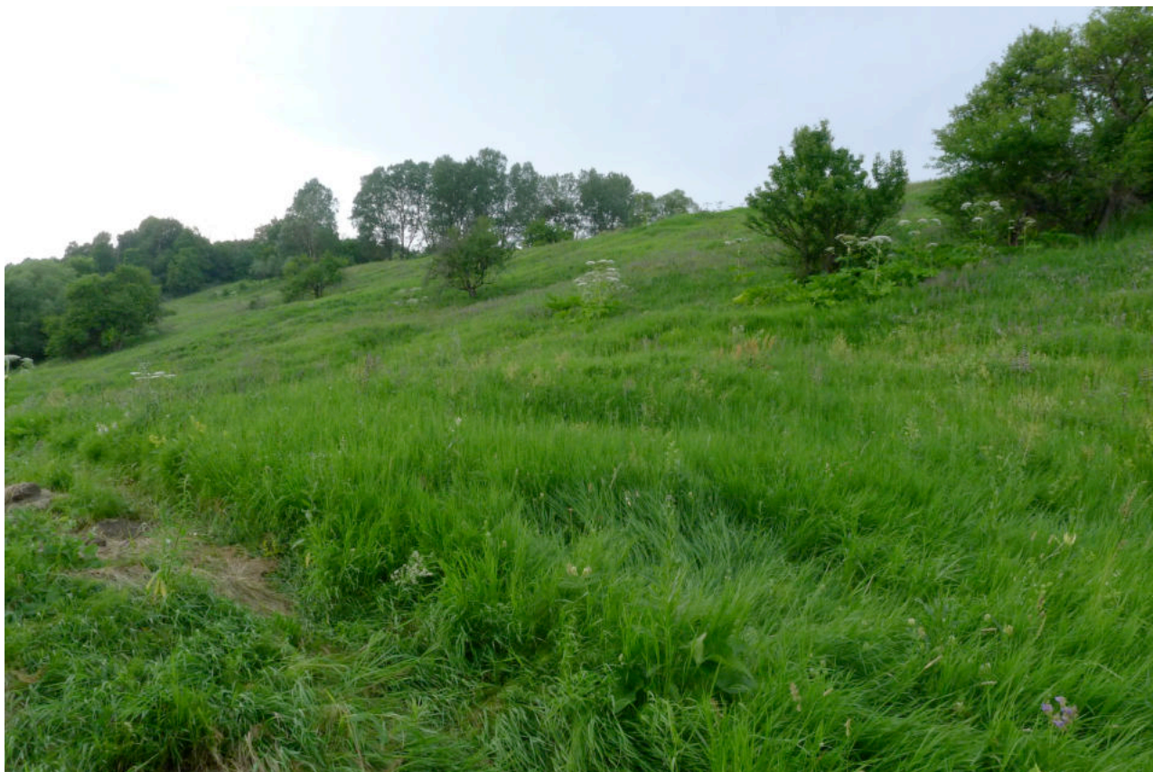
Фото 3. Южная часть «Усадьбы Авчурино» - место прохождения трассы ВОЛС. Вид с востока.