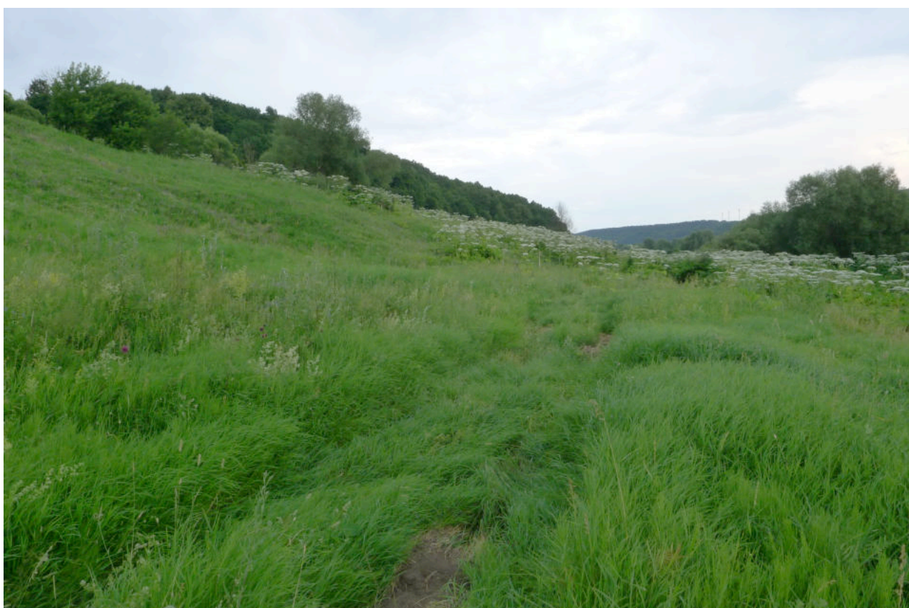
Фото 4. Юго-восточная часть «Усадьбы Авчурино» - место вблизи выхода трассы ВОЛС с территории объекта культурного наследия. Вид с запада.