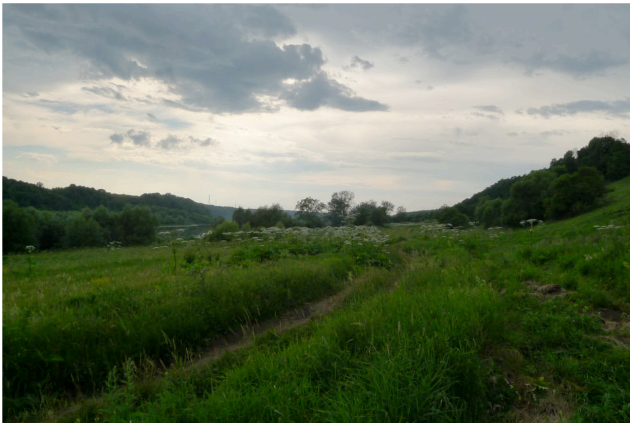
Фото 5. Южная часть «Усадьбы Авчурино» - место прохождения трассы ВОЛС. Вид с востока. В нижней левой части кадра – грунтовая дорога, проходящая вдоль р. Оки по всей территории объекта культурного наследия.