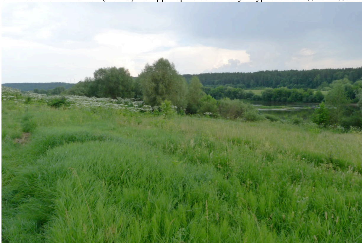
Фото 2. Южная часть «Усадьбы Авчурино» - место прохождения трассы ВОЛС. Вид с запада.